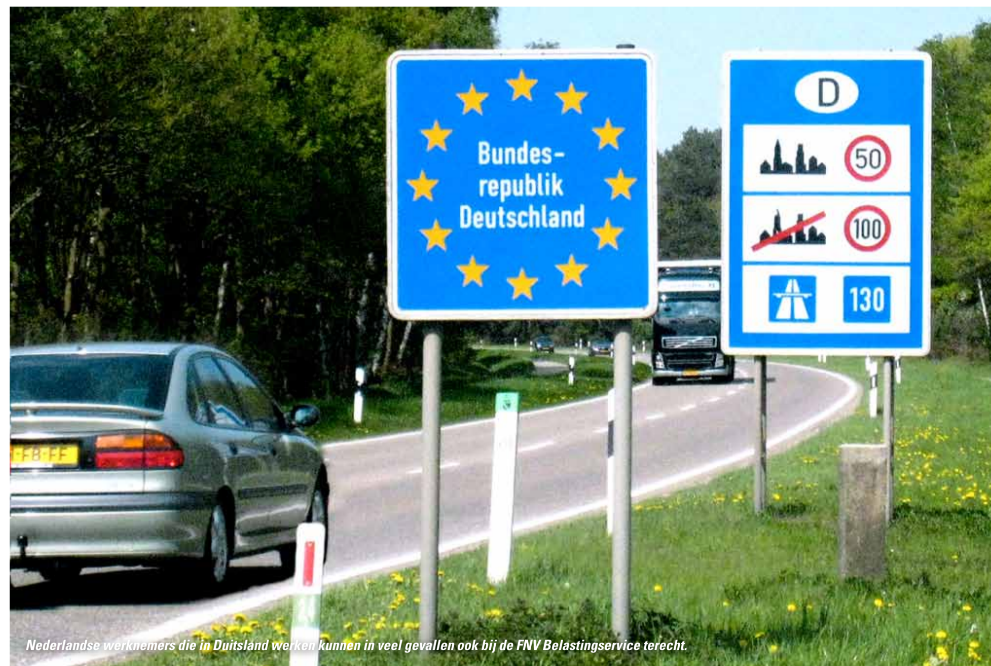
Nederlandse werknemers die in Duitsland werken kunnen in veel gevallen ook bij de FNV Belastingdienst terecht.