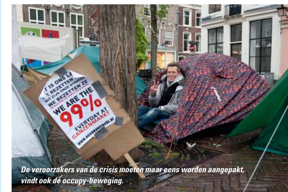
De veroorzakers van de crisis moeten maar eens worden aangepakt, vindt ook de occupy-beweging.

U kunt via onze website www.fnvbondgenoten.nl op de hoogte blijven. Uiteraard blijven wij u ook via OuderenWijzer op de hoogte houden. <