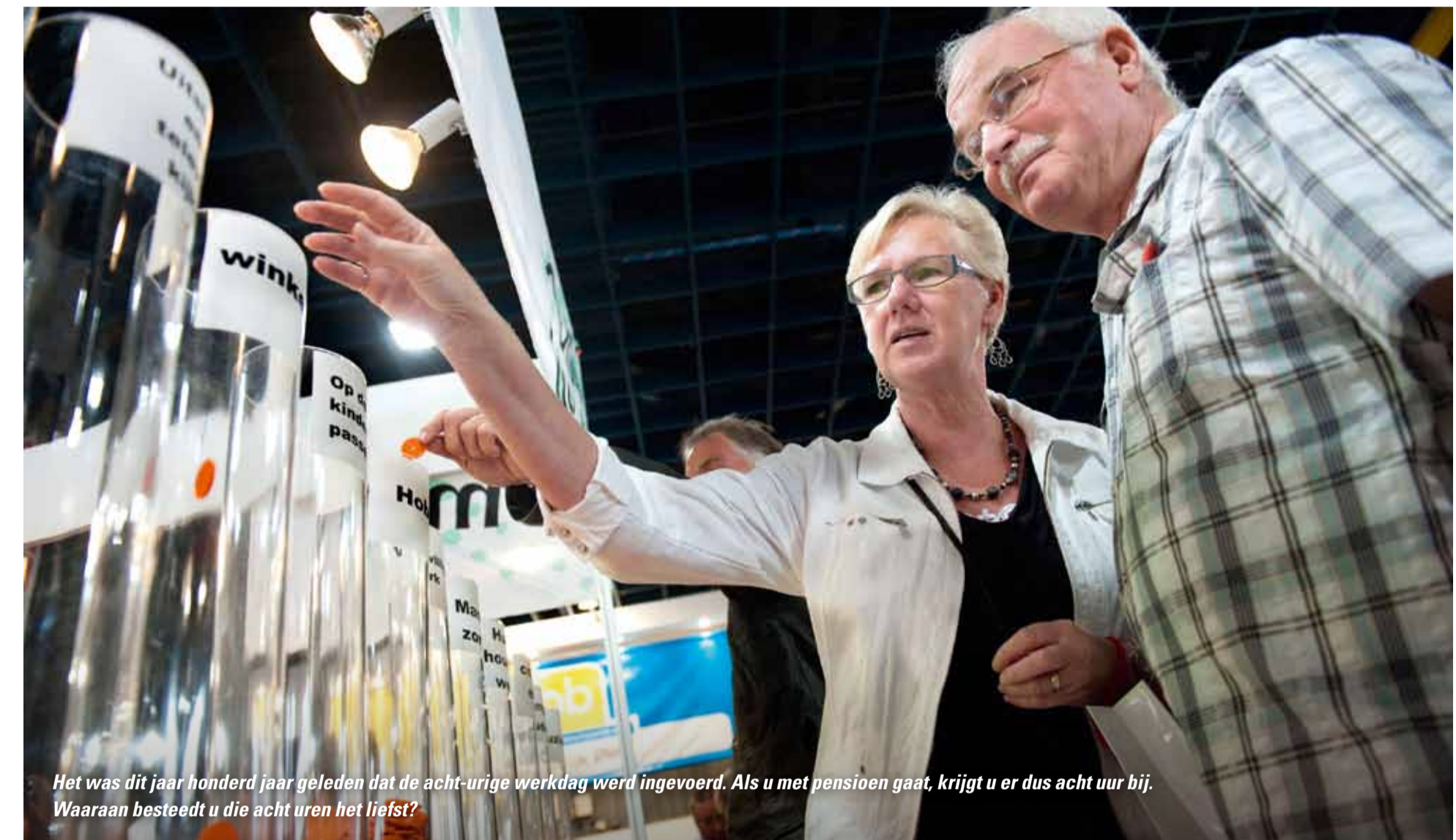
Het was dit jaar honderd jaar geleden dat de acht-urige werkdag werd ingevoerd. Als u met pensioen gaat, krijgt u er dus acht uur bij. Waaraan besteedt u die acht uren het liefst?

de 11 keuzemogelijkheden van de enquête met elkaar voerden, waren soms hilarisch. Zelfs de heren van het satirisch programma Koefnoen deden hieraan volop mee. Zo bleek in de uitzending van hun programma op zaterdag 17 september. U kunt deze uitzending nog bekijken, op www.uitzendinggemist.nl . Zo als het er nu naar uit ziet zal FNV Bondgenoten ook in 2012 weer aanwezig zijn op de 50plus beurs. <