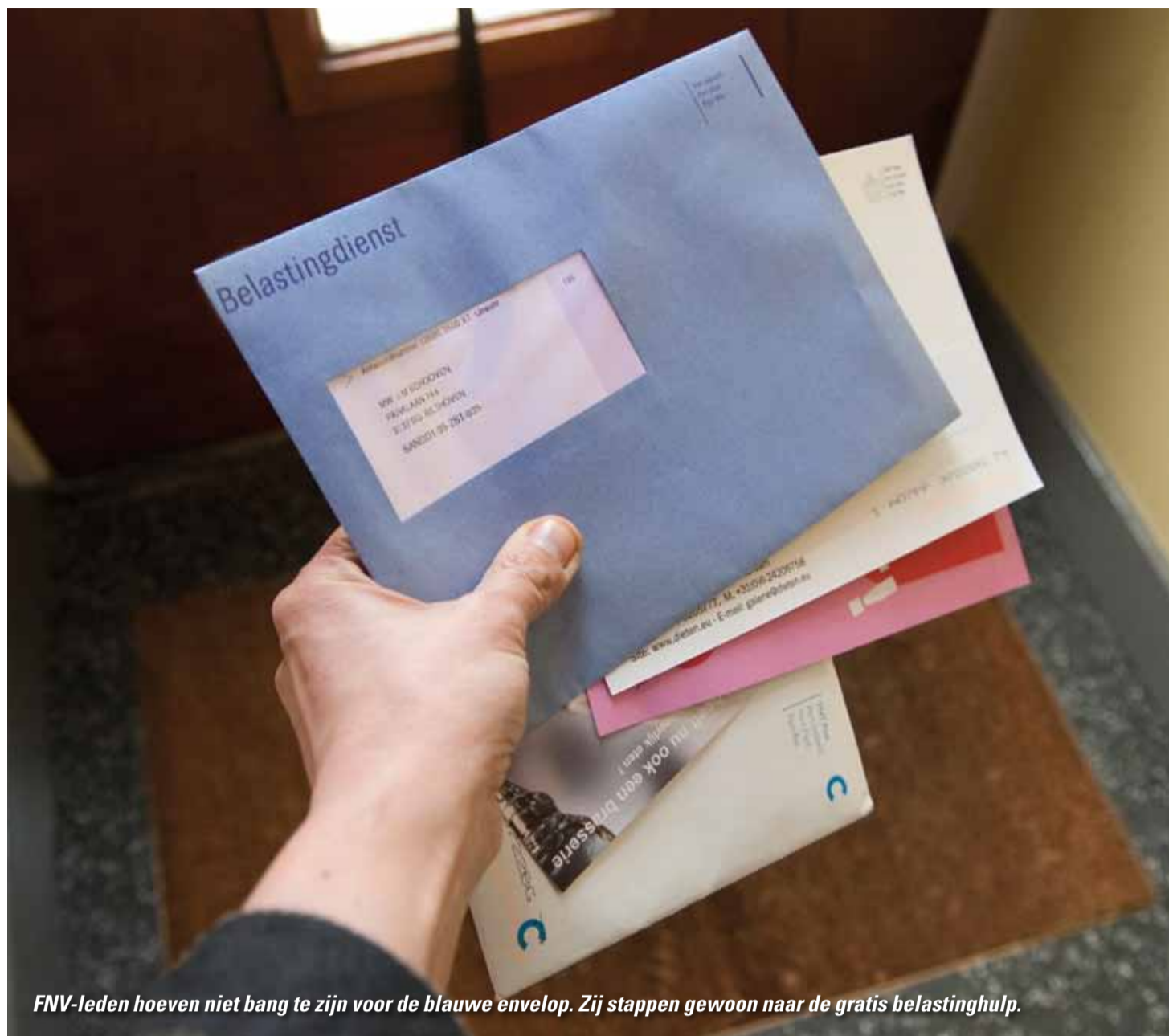
FNV-leden hoeven niet bang te zijn voor de blauwe envelop. Zij stappen gewoon naar de gratis belastinghulp.