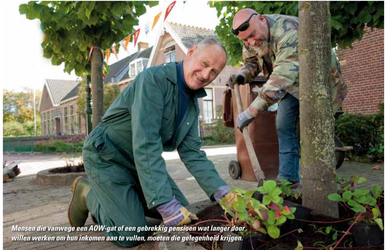
Mensen die vanwege een AOW-gat of een gebrekkig pensioen wat langer door willen werken om hun inkomen aan te vullen, moeten die gelegenheid krijgen.

De werkgevers staan niet bij het voorstel te juichen. Zij zien extra kosten van ontslagprocedures en